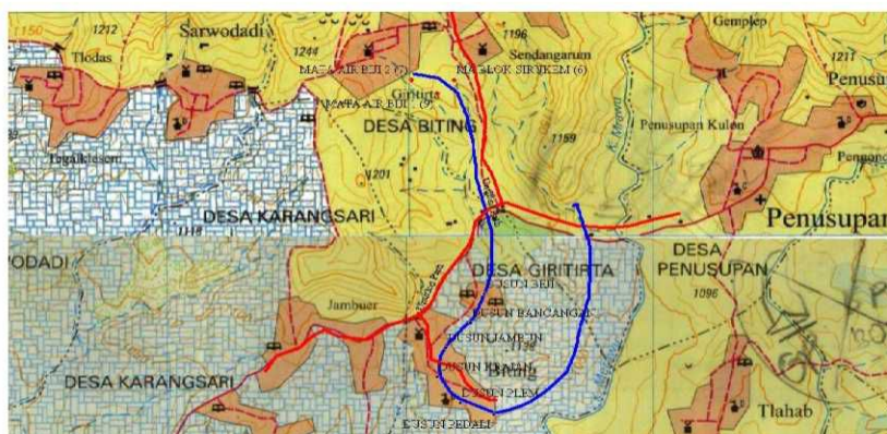
Foto - foto lokasi